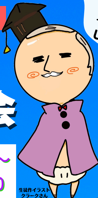
生徒作イラスト クラークさん